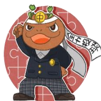
石部中学校創立50周年記念マスコットキャラクター「ぜんりょくん」

5(金)第1回定期テスト 地区別集会 8(月)第1回定期テスト (給食なし) 16(火)第3回生徒会委員会 22(月)③④PTA親子スマホ研修 26(金)文化祭(合唱コンクール) 30(火)3年親子進路説明会 *完全下校時刻 最大 17:30